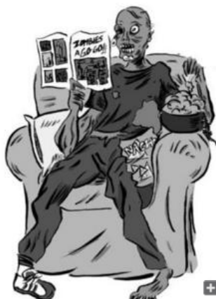
Los zombis están muy vivos y bien adaptados al siglo XXI.

Sol Meliá. Hoteles en Madrid Web oficial Hoteles Reserva tu hotel en Madrid con eDreams Renault Ocasión Renault Ocasión: turismos y comerciales El seguro de tu coche ahora en Fenix Directo